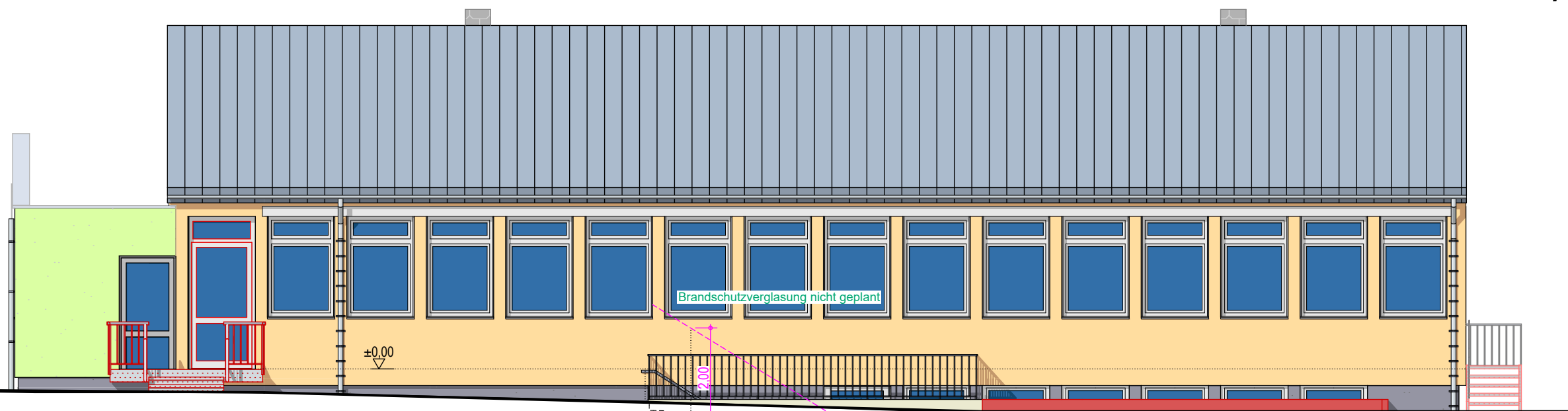
ANSICHT VON WESTEN LINKE SEITE